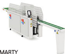
SMARTY Empileur lat. Roll-off (par entraîn.) Impilatore lat. Roll-off (per trascinamento)

Système de pliage par photocellules et air comprimé.