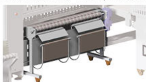
Empileur lat. compact à lame Impilatore lat. compatto a lame