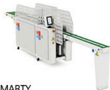
SMARTY Plegadora prend. pequeñas Small garment folder

*Producción y velocidad máximas, variables según modelo, configuración y condiciones de trabajo.