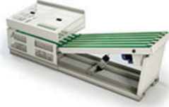
2 Apilador lat. Roll-Off (por arrastre) Side stacker Roll-Off