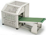
1 Apilador lat. compacto por palas Side standard stacker by blades