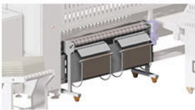
3 Recogedor post. + bypass (2/4 vías) Rear collector + bypass (2/4 lanes)