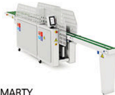
SMARTY Plegadora prend. pequeñas Small garment folder

*Producción y velocidad máximas, variables según modelo, configuración y condiciones de trabajo.